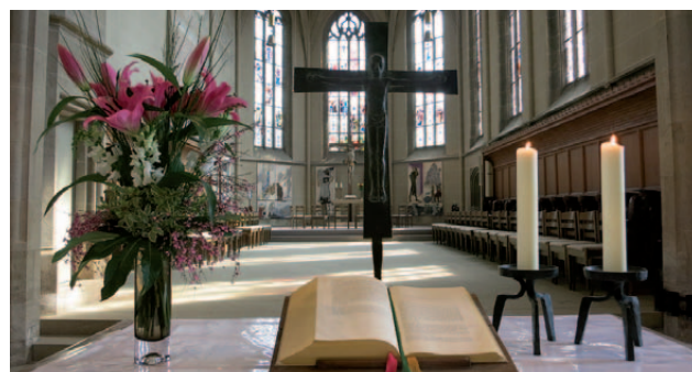
Altarbibel in der evangelischen Kirche Markgröningen.

Das Wort „Bibel“ kommt vom griechischen Wort „Biblia“ und bedeutet „Bücher“. Damit ist schon durch den Namen angedeutet, dass die heilige Schrift der Christen aus einer Vielzahl von unterschiedlichen Schriften besteht. Diese sind in die beiden großen Teile des Alten und des Neuen Testaments gegliedert. Das Alte Testament der christlichen Bibel entspricht weitgehend dem Tanach. Im Neuen Testament erzählen und deuten vier Evangelien das Leben Jesu.