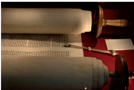
Torarolle mit Lesehilfe (Jad).

Man kann die heiligen Schriften des Judentums in drei große Abteilungen einteilen. Besonders bedeutsam ist (1.) die Thora (deutsche Übersetzung = „Weisung“). Die Übersetzung zeigt: Die Thora ist die Weisung Gottes zum Leben.