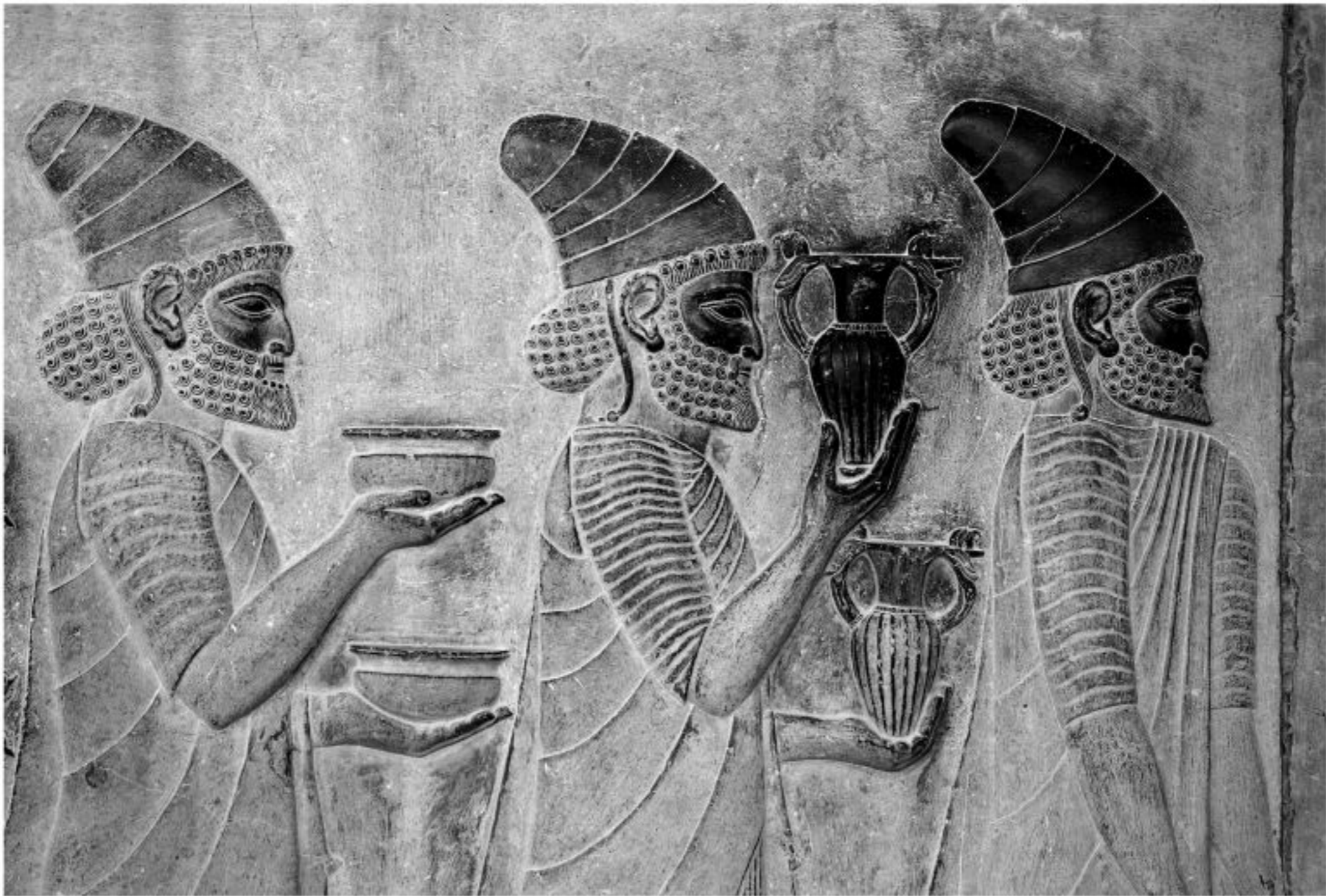
Abb. 3: Eine Delegation an der östlichen Treppe der Apadana

Die Gegensätze zwischen dem reichen Leben der Ägypter in ihrem fruchtbaren Land und ihrem negativ geprägten Verständnis von der Existenz außerhalb des Kulturlandes am Nil werden herausgestellt durch starke Ägypter, die die Früchte der vom Nil bewässerten Region tragen, gegenüber verhungernenden Nomaden, die weit entfernt von solcher Fruchtbarkeit leben (s.u., 5. Hunger und Hungersnot). Ein ähnliches Bild bietet sich in neuassyrischen Palästen, in denen die Wände mit zahlreichen Fruchtbarkeitsbildern bedeckt sind. Dazu zählen auch Szenen mit Kriegsbeute, die Tiere für die Tafeln der Könige und Götter zeigen. Dabei werden Opfer- und Festszenen oft in nächster Nähe zu Siegesszenen dargestellt, in denen die Beute in Empfang genommen wird. So gibt es aus der persischen Zeit in den Ruinen des achämenidischen (persischen) Palastes in Persepolis (Iran), des sogenannten Apadana, Darstellungen von Tributträgern, die aus dem gesamten Reich begehrte Güter herbeibringen, die zumeist für den Konsum am Hof bestimmt sind.