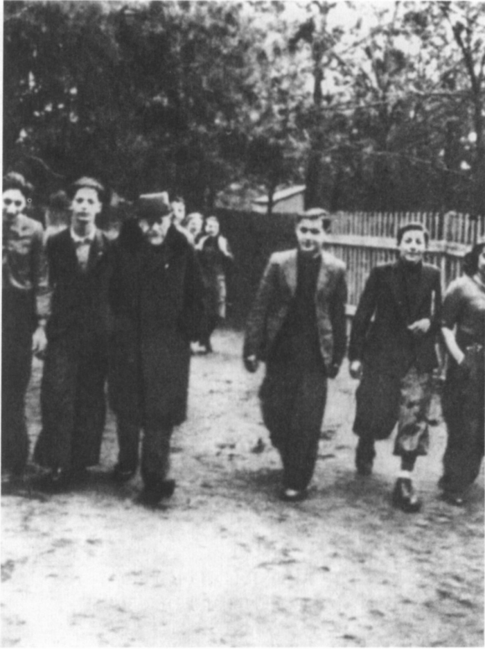
Henryk Goldszmit/Janusz Korczak mit Teilnehmern eines Pädagogik-Kurses in Falenica bei Warschau (1939)