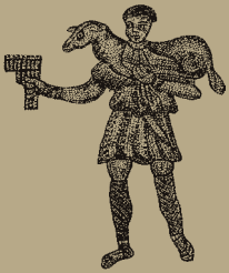
Abb. IX: Der gute Hirte, Mosaik aus Aquileia (Zeichnung: Ernst Brückelmann)

sich ein dramatischer Kampf der Seleukiden gegen die um ihre Freiheit und ihren Glauben kämpfenden Juden, der Aufstand der Makkabäer (167–143/2 v. Chr.). In dessen Folge erkämpften sich die Juden unter hohem Blutzoll das Recht, Jahwe im Jerusalemer Tempel opfern und die Tora halten zu können.