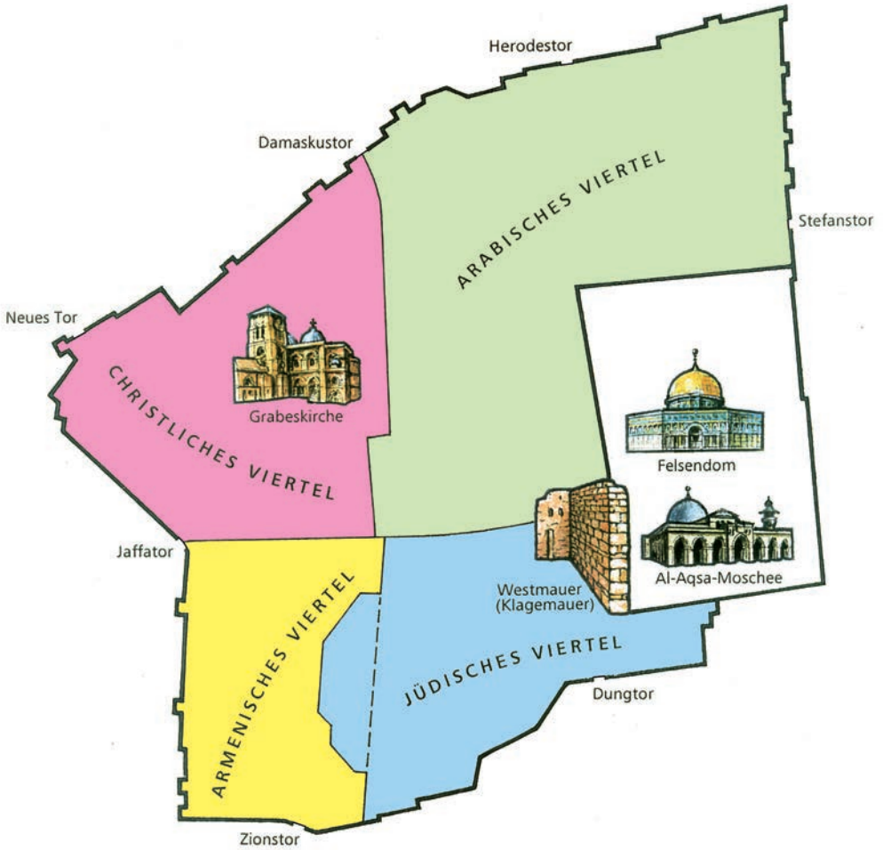
Abb. 2: Altstadt Jerusalem