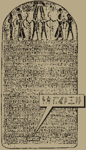
Abb. V: »Israel«-Stele des Pharaos Merenptah (Vieweger 2006, 80 Abb. 57)