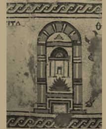
Abb. VII: Stilisierte Jerusalemer Tempel (Vieweger 2006, 353 Abb. 275)

520 bis 332 v. Chr. Eisenzeit III (= Perserzeit)