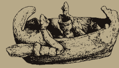
Abb. III: Zyprisches Schiffsmodell, Eisenzeit (Vieweger 2006, 250 Abb. 192)

Im Alten Testament werden zwei unterschiedliche Mitteilungen über die Herkunft der Israeliten und Judäer gemacht. Einerseits erzählt die Familiengeschichte von Abraham, Isaak und Jakob, wie die im Lande zuvor nomadisch lebende Bevölkerung sesshaft wurde (Buch Genesis). Diese machte offenbar den Hauptteil der späteren Israeliten und Judäer aus. Zum anderen berichtet das Buch Exodus von der Flucht einer von Mose geführten Gruppe aus Ägypten, die schließlich am Berg Nebo