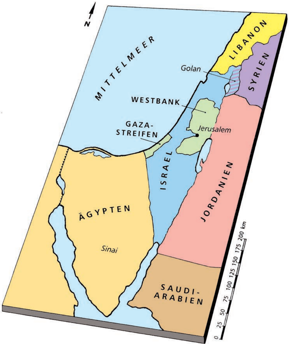
Abb. 1: Politische Karte der südlichen Levante