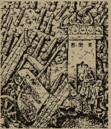
Abb. VI: Assyrischer Angriff auf eine jüdä- ische Stadt (Vieweger 2006, 242 Abb. 183)

östlich des Jordans ankam (Bücher Numeri und Deuteronomium). Dort hätten sie ins verheißene Land geblickt und seien schließlich nach Moses Tod aufgebrochen, um im »Heiligen Land« zu siedeln.