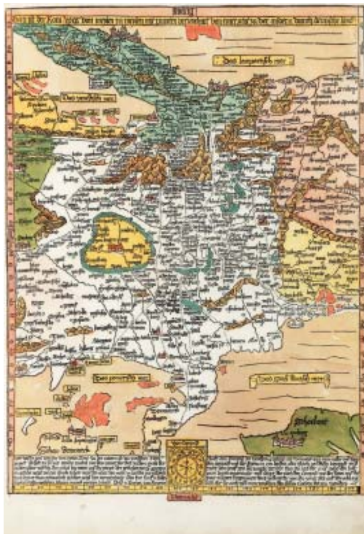
1 Etzlaubs Romweg-Karte, gedruckt zum Heiligen Jahr 1500