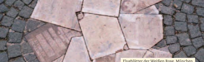
Flugblätter der Weißen Rose, München

Ihr Vater Robert Scholl, überzeugter Pazifist, erfährt die Konsequenzen der Überwachung am eigenen Leib: In Gegenwart einer Angestellten nennt er Hitler »eine große Gottesgeißel«. Er erhält Berufsverbot und wird zu einer viermonatigen Gefängnisstrafe verurteilt. Wenn er in seiner einsamen Zelle die Flötenmelodie »Die Gedanken sind frei« vernimmt, dann ist es Sophie, die ihm heimlich in der Nähe des Gefängnisses vorspielt.