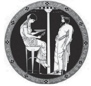
Abb. 2: Aigeus befragt das Orakel zu Delphi

Aus dem griechischen Raum ist wahrscheinlich das Orakel von Delphi der bekannteste Ort, an dem prophetische Auskünfte erteilt wurden. Doch schon dieses wurde oft missverstanden. So wurde dem Lyderkönig Krösus auf seine Frage, ob er gegen die Perser in den Krieg ziehen solle, die Prophezeiung zuteil: «Wenn Du den Halys überschreitest, wirst du ein grosses Reich zerstören.» Krösus überschritt daraufhin den Grenzfluss und zerstörte ein grosses Reich – sein eigenes! 17 Doch nicht weil die Prophezeiung falsch gewesen wäre, sondern weil er nur auf seine eigene statt auf die göttliche Stimme gehört hatte. Hätte er die Inschrift am Apollotempel, in dem das Orakel war, gelesen – «Erkenne dich selbst» – und danach gehandelt, wäre ihm sein Grössenwahn bewusst geworden.