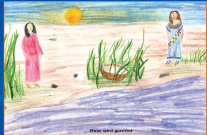
Mose wird gerettet