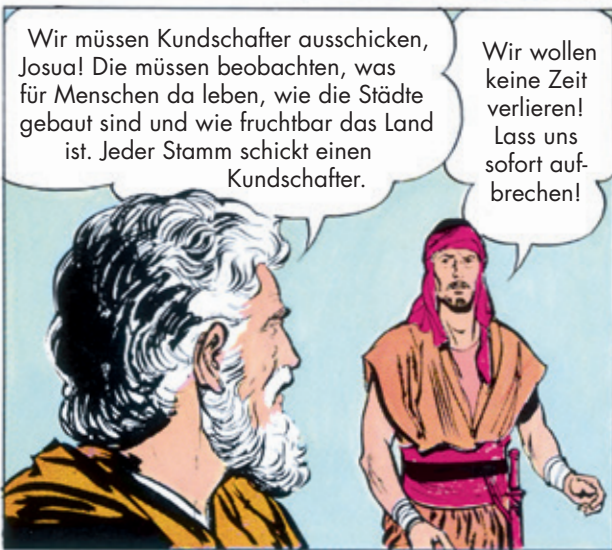
Bei Tagesanbruch machen sich die Kundschafter auf den Weg.