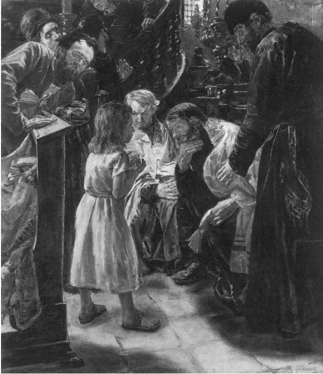
Max Liebermann: Der zwölfjährige Jesus im Tempel 1879 (Kunsthalle Hamburg)

In Folge des Sturms der öffentlichen Entrüstung übermalte Liebermann sein Bild, bevor es 1884 noch einmal in einer Pariser Ausstellung zu sehen war. Dank einer erhaltenen Skizze weiß man aber, dass Liebermann ursprünglich einen barfüßigen Knaben mit kurzem, ungekämmtem schwarzem Haar und einem stereotypisch jüdischen Profil dargestellt hatte. In der