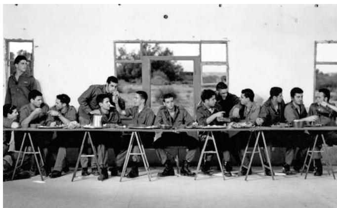
Adi Nes, Untitled, 1999, Chromogen print, The Israel Museum, Jerusalem