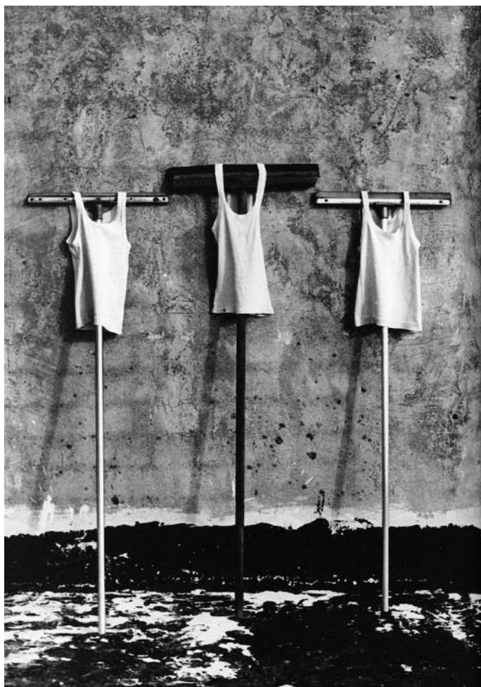
Efrat Natan, Roof Work – Golgotha, 1979, picture from installation, gelatin silver print, The Israel Museum, Jerusalem.