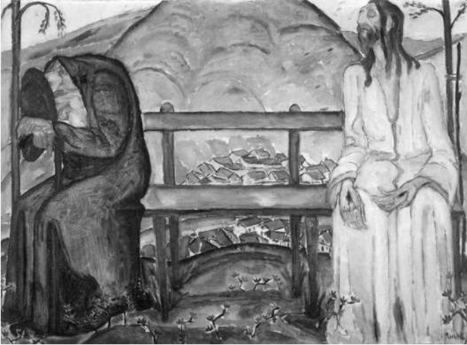
Reuven, Rubin, The Encounter, 1922, Oil on canvas, Collection Phoenix Insurance, Tel Aviv.

jahrhundertlang durch die christliche Umwelt zum Leid des jüdischen Volkes umgemünzt wurde. Im gemeinsamen Leid entsteht eine Solidarität gegen Verfolgung und Antisemitismus. Amitai Mendelsohn geht in seiner Auslegung so weit, zwischen Jesu Auferstehung und der Erneuerung des Jüdischen Volkes im eigenen Staat einen symbolischen Parallelismus zu sehen. Jesus würde zum „regenerated Jew destined to take his place and thereby heal the suffering of the Diaspora!“ 6