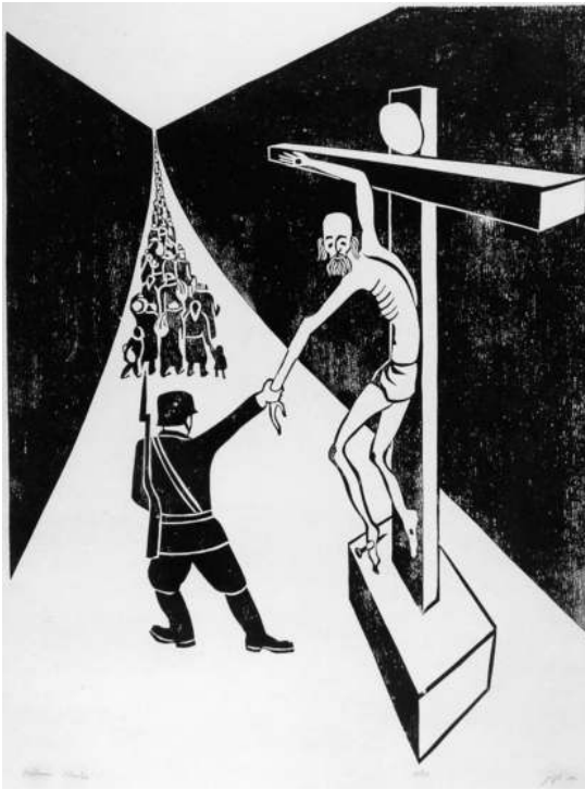
Moshe Hoffman, Woodcut from 6,000,001-series, 1967, (courtesy:) Yad Vashem Museum, Jerusalem.

lidarische Linie vom Leiden Jesu zum Leid des jüdischen Volkes. Im Kreuzestod Jesu zeigt sich für Hoffman der Tod des Göttlichen, aber auch das Vertrauen in die Berufung des Menschen zur schöpferischen Gestaltung der Welt. 7 Der Gegensatz zwischen Juden und Christen löst sich auf, die Darstellung macht aber deutlich, dass Jesus zuallererst Jude sei. Damit deckt Hoffman eindrücklich das Versagen der Menschen auf, die sich auf Jesu Lehren beziehen und doch das Volk Jesu stets miss-