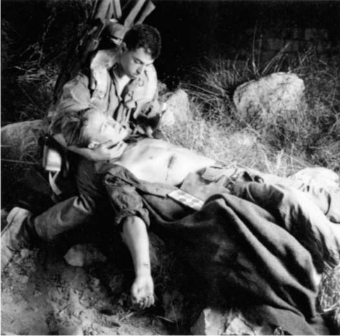
Adi Nes, Untitled, 1995, Chromogen print, Israel Museum, Jerusalem.

rend freimütig christlicher Motive bedienen. Jesus ist hier schon längst der jüdische Bruder geworden, der nicht wie Jahrhunderte zuvor gegen sein Volk gerichtet wird, sondern in einem Akt der künstlerischen Heimholung als Projektionsfläche jüdischer Identitätsbewältigung dienen kann.