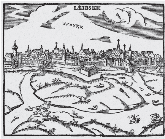
Stadtansicht von Leipzig. Holzschnitt aus Sebastian Münsters «Cosmographia», 1541