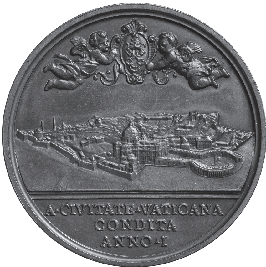
Der Vatikan aus der Vogelperspektive Päpstliche Medaille von 1930 zum ersten Jahrestag der Gründung des Staates der Vatikanstadt