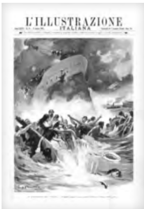
Die Sirio, die Frisca, die Mafalda – die Tragödien verschmolzen miteinander.

Und doch machten sich die Menschen immer wieder auf diesen gefährlichen Weg. Meist von der Armut getrieben, manchmal auch vom Zorn. Um das eigene Los zu ändern oder der Tragödie eines Krieges zu entgehen, vor allem kurz bevor sich der Erste und Zweite Weltkrieg ankündigten. Um sich den Einberufungsbefehlen zu entziehen oder nachdem man dem Tod ins Angesicht geblickt hatte. Um die Familie wieder zu vereinen, um nicht mehr Not leiden zu müssen, um ein besseres Leben zu haben. Das ist keine neue Geschichte, es gab sie gestern, es gibt sie heute. »Schlechter als jetzt kann es mir nicht mehr gehen. Allerhöchstens werde ich dort genauso hungern wie hier. Dighio ben? «, sagt ein Emigrant in Edmondo de Amicis' Buch Auf dem Ozean . »Stimmt