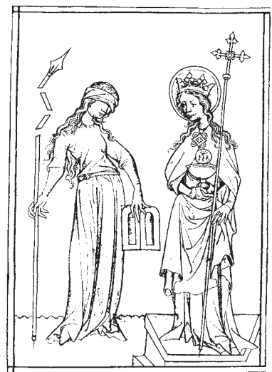
Synagoga und Ecclesia, Miniatur, Frankreich, 14. Jh.