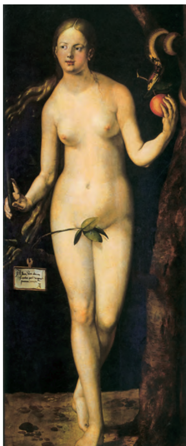
Albrecht Dürer (1471–1528), Eva, 1504.