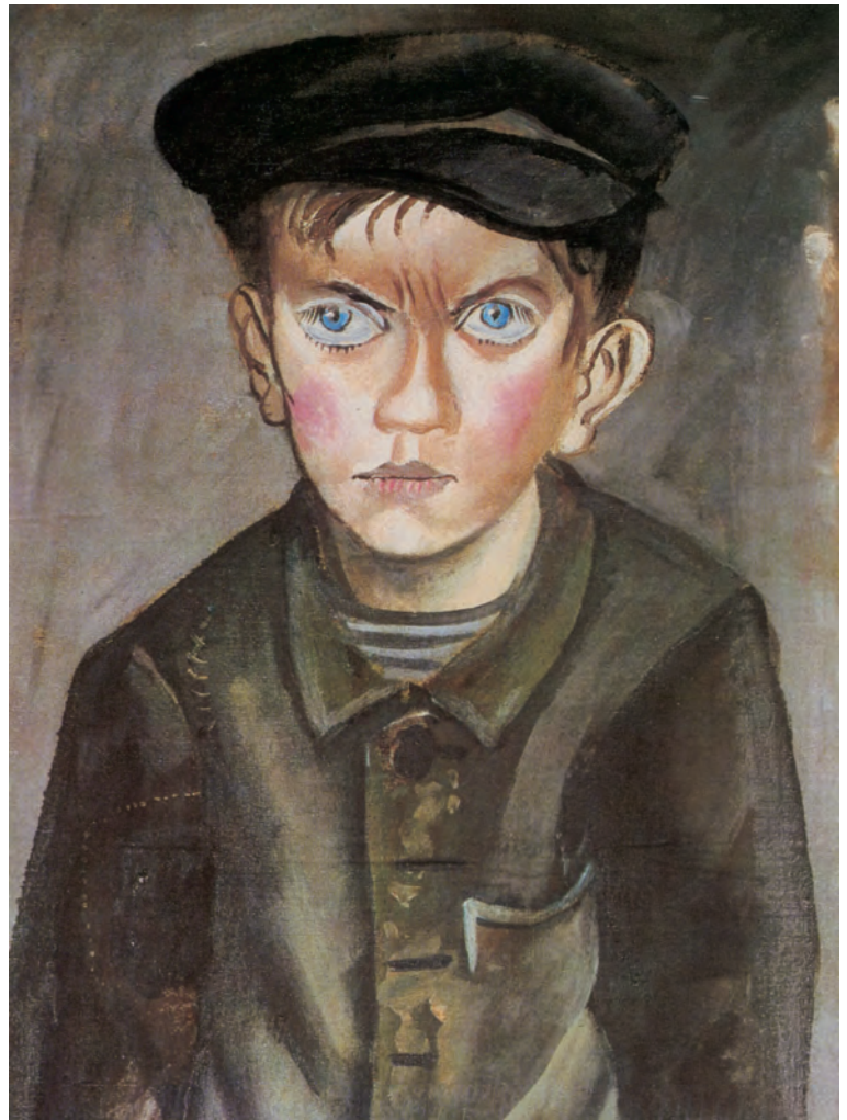
Otto Dix (1891–1969), Arbeiterjunge, 1920.

In der Passage bei Markus darf der Kernsatz, der das Kind für die Haltung gegenüber der Gottes Herrschaft herausstellt, als authentische Jesus-Überlieferung gelten. In der Gemeinde könnte darüber gestritten worden sein, wie mit Kindern umzugehen sei: ob man alle Kinder anzunehmen und zu schätzen habe, oder ob sie nicht doch ein Nichts seien. Selbst die Rahmenerzählung (10,13.14a.; 16) macht dann klar, daß die Gottesherrschaft ins Reich der Hilflosen, der Ohnmächtigen und Nichtsnutze führt.