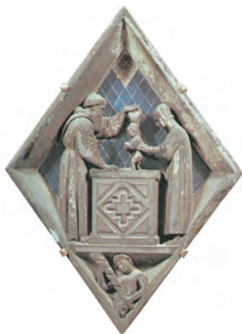
Die Taufe, Darstellung von Giotto di Bondone (1267–1337).