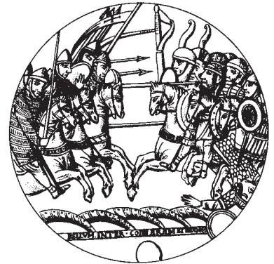
Fenstermalerei der Abteikirche St. Denis.