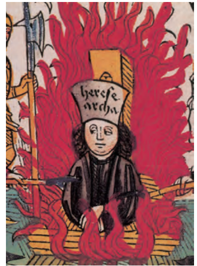
Die Verbrennung des Jan Hus, Miniatur aus der Chronik Ulrichs von Richenthal, 15. Jh.