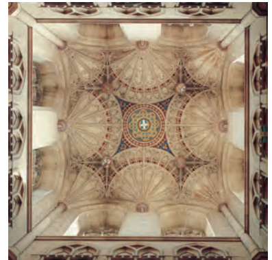
Fächergewölbe in der Kathedrale von Canterbury.