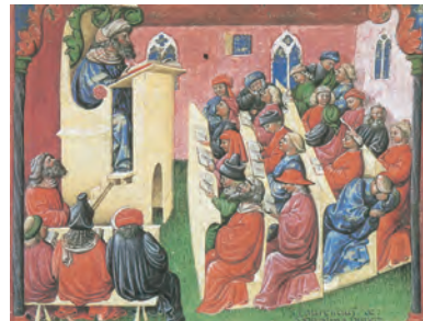
Vorlesung an einer Universität, Miniatur, 14. Jh.