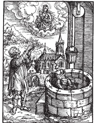
Rettung eines Kindes aus einem tiefen Brunnen, Holzschnitt, um 1520.