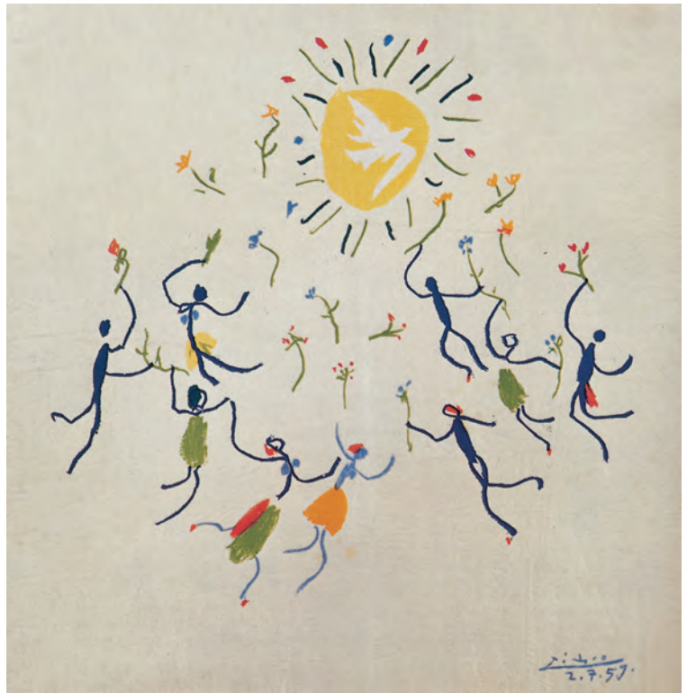
Pablo Picasso (1881–1973), Tanz der Freundschaft, 1959.

Die Vertreibung der »Hellenisten« aus Jerusalem war ein wesentlicher Impuls für die weitere Ausbreitung der Jesus-Bewegung. Die betroffenen Männer und Frauen zogen in andere Städte der hellenistischen Welt und gründeten dort Gemeinden im Sinne ihrer torakritischen Auslegung des jüdischen Glaubens. Sie verursachten überall ähnliche Auseinandersetzungen mit jüdischen Mitbürgern, und ihre Gemeindegründung in der syrischen Großstadt Antiochia wirkte sogar bald auf die »hebräische« Gemeinde in Jerusalem zurück: