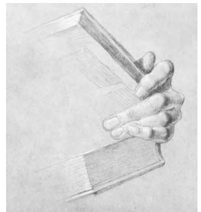
Albrecht Dürer (1471–1528), Handstudie zum Bild »Der zwölfjährige Jesus unter den Schriftgelehrten«, 1506.