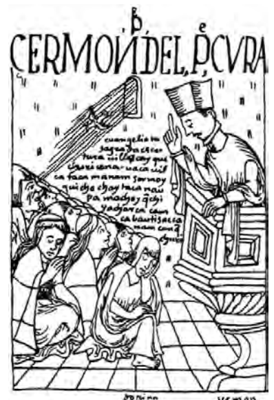
Predigt für die Indios, Bilderchronik des Felipe Guamán Poma de Ayala, um 1615.