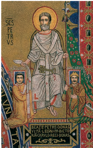
Petrus überreicht Karl dem Großen die Fahne und Papst Leo III. die Stola, Rekonstruiertes Mosaik, Lateranpalast, um 799.