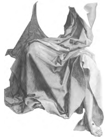
Albrecht Dürer (1471–1528), Studie zum Gewand Jesu, 1508.