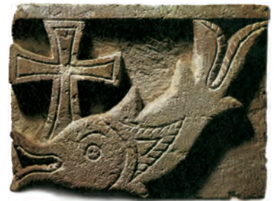
Fisch mit Kreuz, Koptisches Relief, Oberägypten, 4. Jh.