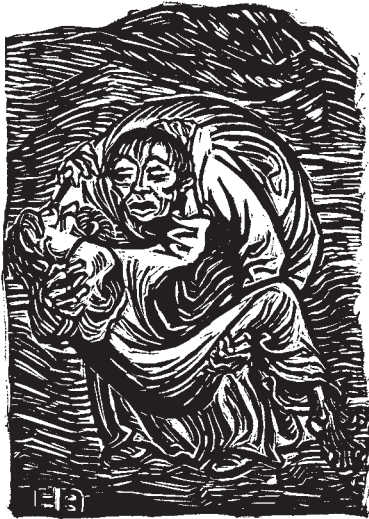
Ernst Barlach (1870–1938), Der barmherzige Samariter , 1919.