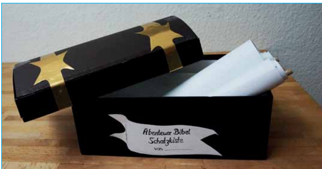
Abb. 2: Schatzkiste zum „Abenteuer Bibel“