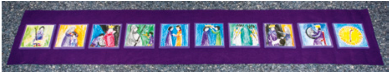
Abb. 13: „David“ (Perspektive der Kinder)

Godly Play-Darbietungen besteht nicht so sehr darin, möglichst genau dem Ablauf der Geschichte des Volkes Gottes zu folgen, sondern vielmehr der Frage, wie Gott in diesen Geschichten begegnet, und der Erfahrung, dass er sich immer wieder als der erweist, der da ist und sich von Menschen finden lässt.