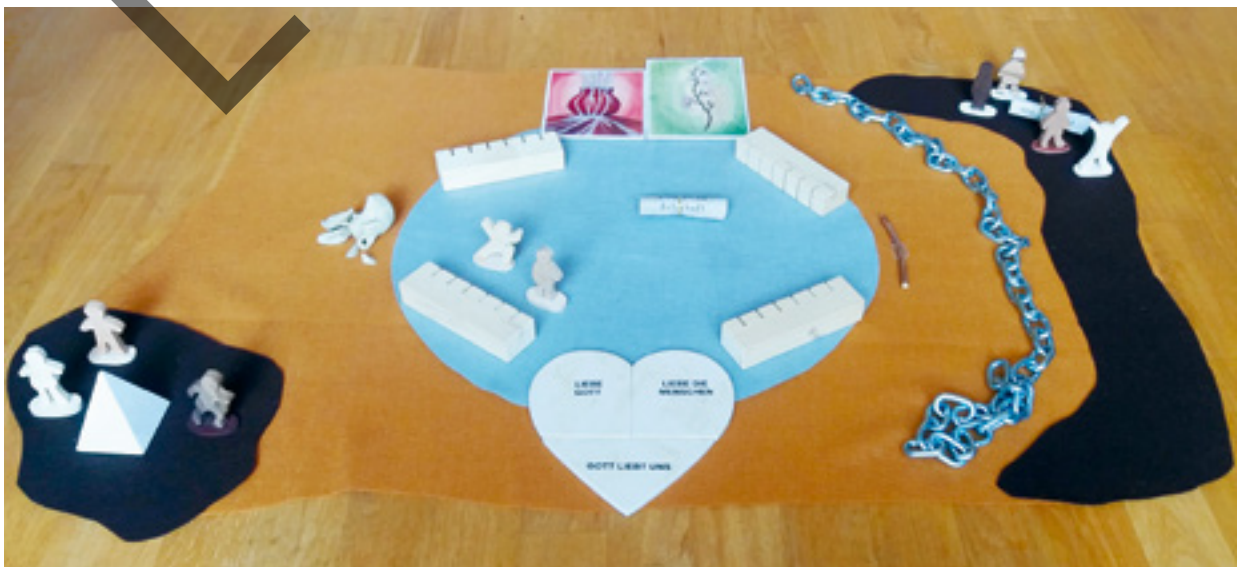
Abb. 5: „Jeremia“ – eine Prophetengeschichte (Perspektive der Kinder)

Auch Prophetengeschichten , die dritte Art der Vertiefung der Glaubensgeschichten aus dem Alten Testament, sind in gewisser Weise Biographieggeschichten. Sie unterscheiden sich von diesen aber dadurch, dass das Leben der Propheten in besonderer und ausdrücklicher Weise von der Ausführung der Aufträge Gottes geprägt ist (ob sie wollen oder nicht). Häufig sind die Botschaften der Propheten geprägt von Visionen und deren Deutung. Oft ist ihr Auftrag nicht leicht und bringt ihnen Hass und Verfolgung ein. In den Prophetengeschichten lautet daher eine so oder ähnlich immer wiederholte Beschreibung der Besonderheit von Propheten, die außerdem mit einer Nähegeste unterstützt wird: