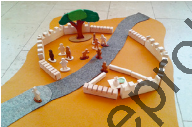
Abb. 14: Zachäus

Nur wenige GOTT IM SPIEL-Geschichten gibt es bisher, die über die Zeit nach Jesu Tod und Auferstehung in der Gattung der Glaubensgeschichte erzählen – d.h. also als Geschichten, die von den Erfahrungen mit Gott und dem auferstandenen Jesus in Raum und Zeit erzählen: vgl. die Godly Play-Einheit „Die Entdeckung des Paulus“ 14 und außerdem die GOTT IM SPIEL-Darbietungen „Woher wir von Jesus wissen (Die vier Evangelien)“, „Der Johannesprolog“ und „Warum wir Ostern feiern (Das leere Grab)“. In gewisser Weise nehmen hier die liturgischen Handlungen den Handlungsfaden insofern auf (vgl. besonders die Darbietung zu Pfingsten), als mit der Entstehung der ersten Gemeinden die Entwicklung hin zur christlichen Kirche beginnt. Es wäre aber eine Engführung, von der Gottessuche, -nähe und -erfahrung nur noch im Rahmen der liturgischen Handlungen zu erzählen und sie somit auf kirchlich vermittelte Erfahrungen zu beschränken. Das Neue Testament selbst bietet neben der Briefliteratur, die selbst nicht narrativ ist, deren Einbeziehung in Erzählzusammenhänge aber durchaus denkbar wäre, besonders in der Apostelgeschichte weitere Erzählungen, die sich der Geschichte der frühen Gemeinden widmen. Hier deuten sich also Möglichkeiten der Neuentwicklung von GOTT IM SPIEL-Darbietungen an, die jenes oben schon (s. Abschnitt 2.1) erwähnte Fehlen von Geschichten, die von der Weitergabe und -entwicklung des Glaubens in neutestamentlicher und nachneutestamentlicher Zeit erzählen, kompensieren könnten.