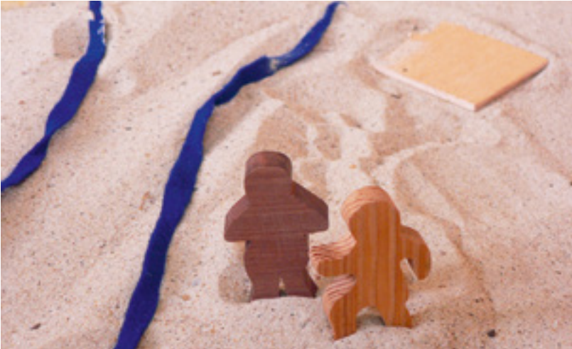
Abb. 2: Ausschnitt aus der Darbietung „Die große Familie“ (Perspektive der Kinder)

Jene Glaubensgeschichten aus dem Alten Testament, die Kerndarbietungen darstellen, thematisieren vor allem Kollektiverfahrungen des Volkes Gottes und erzählen von der Gemeinschaft untereinander und mit Gott. Als Godly Play- bzw. GOTT IM SPIEL-Darbietungen wollen sie bei den Kindern ein Gespür für diese Glaubensgemeinschaft entwickeln. Es sind Darbietungen, die ein Mitgehen und eine Identifikation ermöglichen. Dies geschieht in GOTT IM SPIEL ausdrücklich aus der Perspektive des Neuen Testaments und der Ausweitung der Heilsbotschaft auf alle Völker. So können sich auch Menschen, die nicht aus dem Volk Israel stammen, als Teil dieser Gemeinschaft verstehen. So können auch die Kinder die Geschichte Gottes mit seinem Volk als Einladung an sich selbst erfahren, zu dieser Gemeinschaft dazuzugehören und sich auf eine Beziehung mit Gott einzulassen.