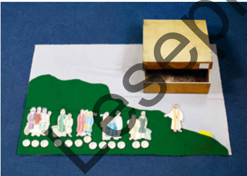
Abb. 9: Gleichnisfiguren mit goldener Schachtel („Die Arbeiter im Weinberg“)