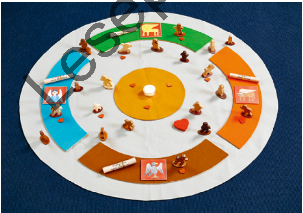
Abb. 8: „Woher wir von Jesus wissen (Die vier Evangelien)“ (Perspektive der Kinder)