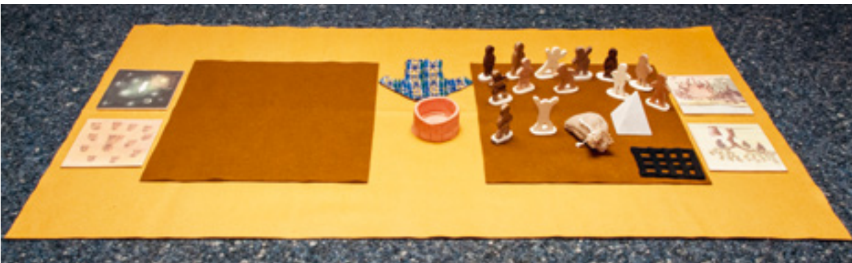
Abb. 3: „Josef“ – eine Biographieggeschichte (Perspektive der Erzählerin)

Menschheitsgeschichten , eine weitere Vertiefung alttestamentlicher Glaubensgeschichten, öffnen den Raum für grundsätzliche existentielle Fragen. Es sind jene Geschichten, die weder die Kollektiverfahrung eines Volkes noch die Individualerfahrung Einzelner thematisieren, sondern Grunderfahrungen des Menschseins überhaupt behandeln: Fragen von Freiheit und Verantwortung, Fragen nach Glück, Schuld und Leid, Fragen nach Zugehörigkeit und Heimat. Für sie hat GOTT IM SPIEL den Erdsack als besonderes Erzählmedium entwickelt.