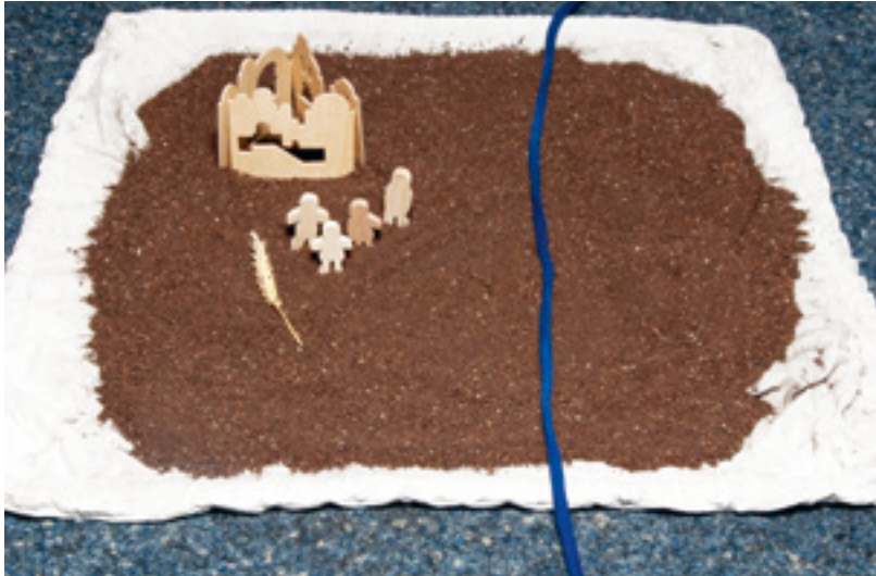
Abb. 4: „Rut und Noomi“ – eine Menschheits- geschichte (Perspektive der Kinder)

Erde ist ein anderer Spiel-Untergrund, als es der Sand der Wüstenkiste oder unterschiedliche Filzunterlagen sind. Sand und Filz stehen in den Glaubensgeschichten immer für konkrete Orte, an denen die Geschichten sich ereignen (ohne dass damit die Möglichkeit eines übertragenen Verstehens prinzipiell ausgeschlossen ist). Erde dagegen ist der Urgrund, der das Menschsein überhaupt bestimmt und mit Fragen konfrontiert: Von Erde sind wir Menschen genommen und zu Erde werden wir wieder werden. Die Erde ist der Ort der Schöpfung, in der wir Menschen als Gegenüber Gottes leben. Erde steht auch für die Geheimnisse, die diese Schöpfung birgt, und für die Fragen, die das Menschsein auf dieser Erde mit sich bringt – Fragen nach dem Woher und Wohin, nach dem Sinn, nach Gelingen und Scheitern. Die vier Menschheitsgeschichten („Im Garten Eden“, „Isaak und Abraham“, „Ruth und Noomi“ und „Hiob“) spielen daher nicht (nur) an einem konkreten Ort auf der Erde. Die Erde steht vielmehr für einen symbolischen Ort, der überall sein kann, wo uns die Fragen dieser Geschichten treffen.