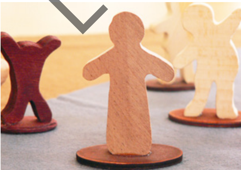
Abb. 6: Jesus-Figur, im Hintergrund andere Volk-Gottes-Figuren mit Standfuß

Die Jesusgeschichten werden auf Filzunterlagen dargeboten, die etwas von der Region andeuten, in der sie geographisch spielen: mittelbrauner Filz für das fruchtbare Galiläa, ockerfarbener Filz für das eher karge Umland von Jerusalem, grauer Filz für Jerusalem. Als Figuren werden Volk-Gottes-Figuren mit Standfuß benutzt (wie auch schon in einigen der Biographie- und Prophetengeschichten, die nicht in der Wüste spielen). So wird die Kontinuität deutlich, in der Jesus und seine ersten Anhängerinnen und Anhänger als Angehörige des Gottesvolkes stehen. Auch in den Jesusgeschichten werden die Figuren nicht festgelegt. Nur die Jesus-Figur ist erkennbar anders und unterscheidbar gestaltet.