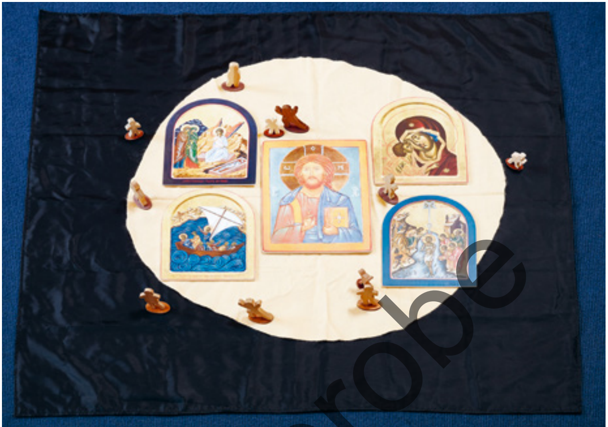
Abb. 7: „Der Johannesprolog“ (Perspektive der Kinder)