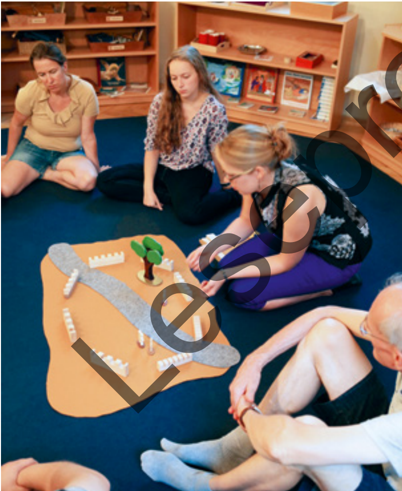
Abb. 1: Darbietung der Geschichte von Zachäus in einer Gruppe von Erwachsenen

Innerhalb einer GOTT IM SPIEL-Einheit ist der Raum für dieses Geschehen bereits vorbereitet durch das Ankommen der Gruppe im Kreis und den Prozess des Bereit-Werdens (s.o. Kap. I). Hier wird auch Raum geschaffen für eine spirituelle Begegnung mit der Geschichte. Der soziale und kommunikative Zusammenhang, in den das Erzählen führt, ist in einer GOTT IM SPIEL-Einheit noch stärker in der folgenden Phase des Ergründens (s.u. Kap. III) zu finden. Die Darbietung der Geschichte selbst zielt dagegen noch nicht darauf, den direkten Austausch mit den anderen zu initiieren. Die Konzentration der Erzählerin bleibt vielmehr ganz bei der Geschichte selbst und will so zuerst Raum dafür geben, dass jedes einzelne Kind, jeder Erwachsene im Kreis für sich der Geschichte begegnen kann.