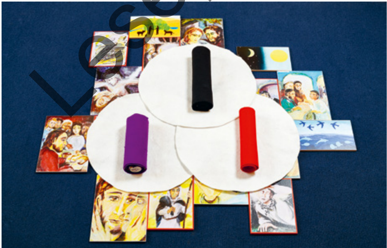
Abb. 12: „Die heilige Dreieinigkeit“ (Perspektive der Kinder)

Schließlich ergibt sich aus der oben ganz allgemein beschriebenen willentlichen Festlegung von Gattungen und der entsprechenden Zuordnung von Geschichten zu diesen Konstrukten des Weiteren die Möglichkeit, diese Zuordnung auch wiederum zu hinterfragen. Zumindest als ein Versuch kann bei einigen Geschichten erwogen werden, was durch einen Genrewechsel in einer Geschichte alles zu entdecken wäre. Sinnvoll ist das aber nur für Geschichten, die in sich bereits Hinweise auf ein anderes Genre enthalten. So lässt sich z.B. fragen, ob „Die sieben Tage der Schöpfung“ nicht auch als liturgische Handlung verstehbar wären. Der Wochenrhythmus beschreibt eine gegenwärtige Zeiteinteilung mit dem Sonntag als kirchlichem Höhepunkt, die Unterlage spielt, anders als bei den meisten Glaubensgeschichten, auf keine bestimmte Gegend an, in der die Geschichte spielt.