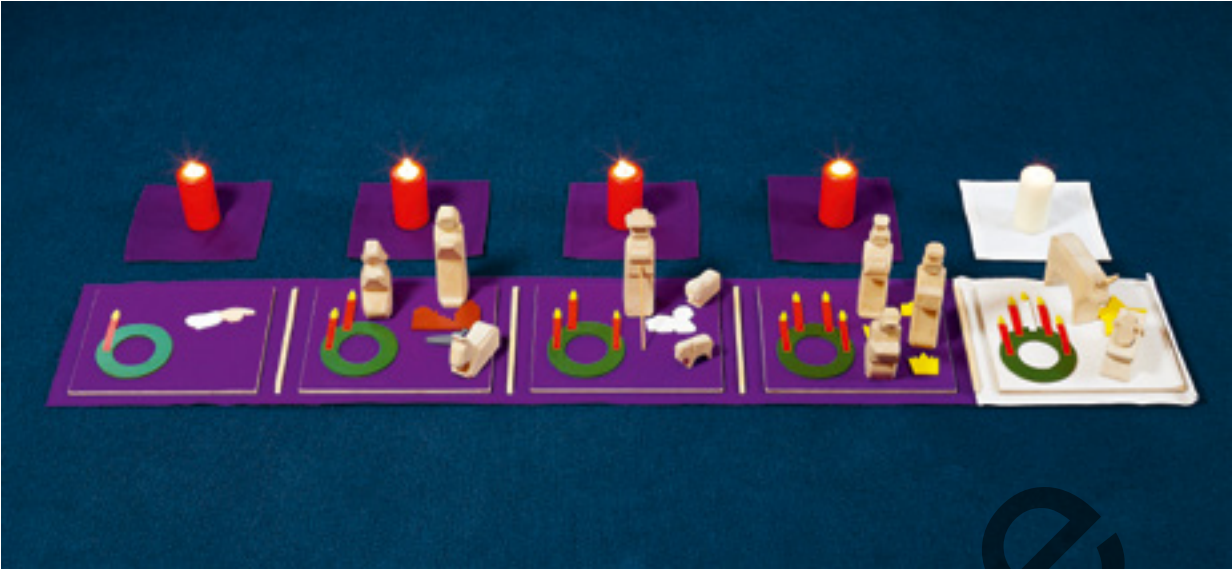
Abb. 10: „Advent I-IV“ (Perspektive der Kinder)

Da die Handlungskontexte (s.u. Kap. VI.3 → S. 219), in denen mit GOTT IM SPIEL in Deutschland gearbeitet wird, sehr verschieden sind und es sich z.T. auch um konfessionell verantwortete öffentliche Bildungsangebote handelt (vgl. besonders den Religionsunterricht), kann es vorkommen, dass in Gruppen mit geringer religiöser Sozialisation kaum Antworten auf die zitierten Fragen kommen, weil eine Vertrautheit mit Kirche und christlichen Festen nicht vorhanden ist. Liturgische Handlungen können für Kinder dann eine gute Möglichkeit bieten, etwas über kirchliche Kontexte und liturgische Vollzüge ganz neu zu lernen.