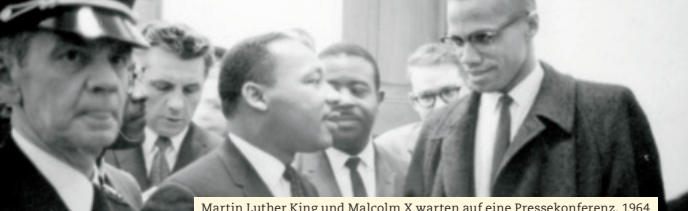
Martin Luther King und Malcolm X warten auf eine Pressekonferenz, 1964