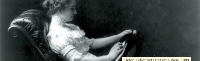
Helen Keller betastet eine Vase, 1909