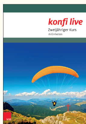
konfi live Zweijähriger Kurs 16 Einheiten Mit digitalem Zusatzmaterial ISBN 978-3-525-61507-2