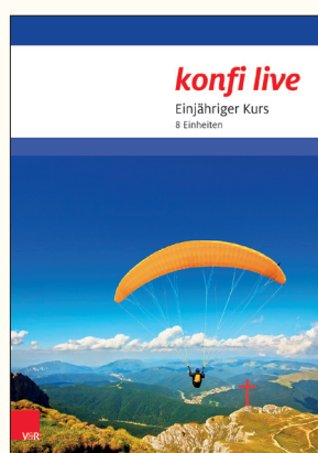
konfi live Einjähriger Kurs 8 Einheiten Mit digitalem Zusatzmaterial ISBN 978-3-525-61508-9