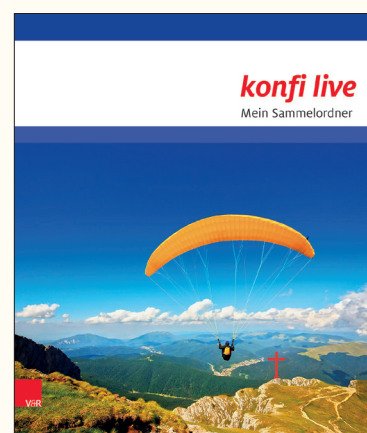
konfi live Mein Sammelordner ISBN 978-3-525-61509-6