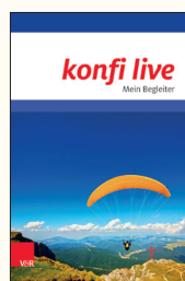
konfi live Mein Begleiter ISBN 978-3-525-61506-5